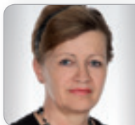
DI Ernst-Kirchmayr Spezialistin für Immobilienent- wicklung DIE ERNST