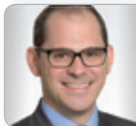
RA Mag. Richter Experte für Bauträgerrecht JOKLIK KATARY RICHTER Rechts- anwälte